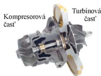
Obr. 5: Turbodúchadlo v reze.

Lopatky v kompresorovej časti už nie sú vystavené vysokým teplotám a to umožňuje použiť lacnejšie materiály. Pomerne často sa dá v súčasných turbodúchadlách nájsť ako materiál pre tanier s lopatkami Al zliatina Al-0.2Fe-5Si-0.2Ti-1.5Cu-0.1Mn-0.5Mg. Pre mimoriadne namáhané turbodúchadlá dieselových motorov sa volí radšej zliatina Ti-6Al-4V.