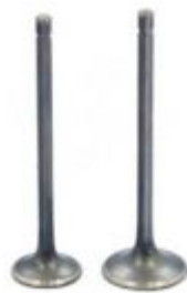
Obr. 4: Výfukový (vľavo) a nasávací (vpravo) ventil.

nasávací ventil je čiastočne chladený vstupujúcim vzduchom, zatiaľ čo výfukový je obtekaný horúcimi plynmi po spálení paliva. Z toho vyplýva ich rozdielna expozičná teplota. V benzínovom motore je teplota nasávacieho ventilu približne v intervale 250 - 450°C a teplota výfukového v intervale 550 - 850°C.