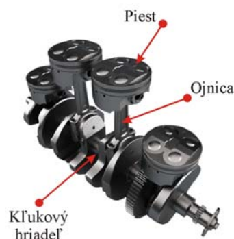
Obr. 3: Príklad konštrukcie kľukového hriadeľa s nasadenými ojnicami a piestami od firmy Yamaha.

Piesty sú priamo vystavené explóziám paliva a energiu z toho získanú prenášajú na pohon kolies. Veľkú úlohu pri materiálovom návrhu tu zohráva typ použitého paliva. Benzínové motory pracujú pri vyšších otáčkach a teda aj rýchlostiach, z čoho vyplýva, že sa viac približujú medzi únavy a podliehajú vyššiemu treniu ako dieselové motory. U dieselových motorov však musíme počítať s výrazne vyšším tlakom a vyššími teplotami. Rozhodujúce je aj chemické zloženie paliva.